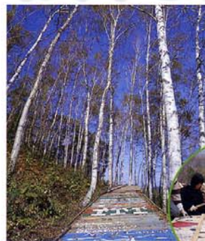
◎平庭山荘 ☎ 0194-72-2700